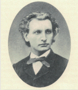
Friedrich Hegar 1841 – 1927

Gerade mal 21 Jahre zählte der Basler Friedrich Hegar, als er 1862 von Theodor Kirchner, dem Leiter der Abonnementskonzerte der Allgemeinen Musik-Gesellschaft (AMG) nach Zürich berufen wurde.